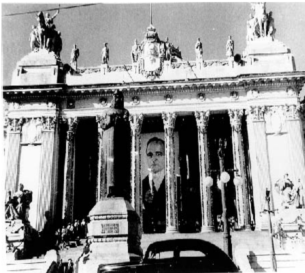
O Palácio Tiradentes, sede da Câmara dos Deputados até o fechamento do Congresso Nacional por Getúlio Vargas, passou a abrigar o Departamento de Imprensa e Propaganda, o DIP. Hoje acolhe a Assembléia Legislativa do Estado do Rio de Janeiro.

Nesse período surgiram os seguintes jornais associados à ANJ: A Tribuna (Vitória-ES), Correio de Uberlândia (Uberlândia-MG), Correio Lageano (Lages-SC), Diário da Manhã (Passo Fundo-RS), Diário de Natal/O Poti (Natal-RN), Gazeta de Alagoas (Maceió-AL), Jornal Cidade de Rio Claro (Rio Claro-SP), Jornal do Comércio (Porto Alegre-RS), O Imparcial (Presidente Prudente-SP), O Popular (Goiânia-GO), O São Gonçalo (São Gonçalo-RJ).